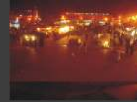
Platz der Gaukler in Marrakesch - Start und Ziel des Enduro-Abenteurers