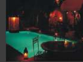
Die Hotels - von gutem marrok. Standard bis gehoben